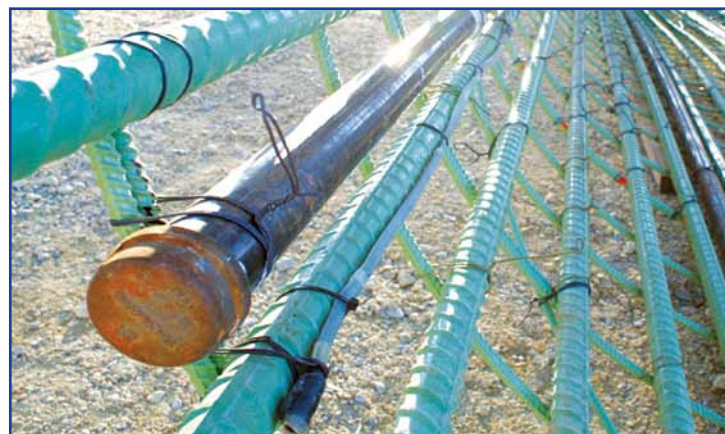
Fiação THERMAL WIRE acoplada à armadura (aparecem também tubos de acesso)