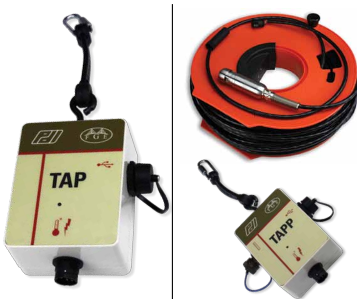
Portas de aquisição térmica para fiação térmica (esquerda) e para sensores térmicos (direita)

O TIP Reporter também estima o recobrimento de concreto ao longo de todo o comprimento da estaca, o diâmetro real do fuste e a posição da armadura. Estas estimativas requerem, além das temperaturas medidas com o equipamento TIP, que seja conhecido o volume de concreto utilizado na execução da estaca. Para uma estimativa mais precisa, o gradiente da temperatura (variação da temperatura ao longo do raio do fuste a uma dada profundidade) é calculado a partir de temperaturas adicionais, obtidas a partir dos quatro sensores ortogonais ou através da instalação de uma fiação térmica adicional a certa distância radial da original.