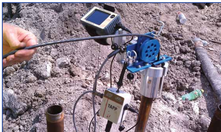
Instrumento para Perfilagem Térmica de Integridade TIP, Modelo Sonda

O TIP Modelo Sonda Térmica 1 inclui uma sonda equipada com quatro sensores infravermelhos, posicionados ortogonalmente, e uma Porta de Aquisição Térmica para sondas (TAPP). Os dados são coletados inserindo-se a sonda em tubos de acesso de PVC ou aço (diâmetro 40 a 50 mm) previamente instalados. (Os resultados do ensaio TIP não são afetados por descolamento